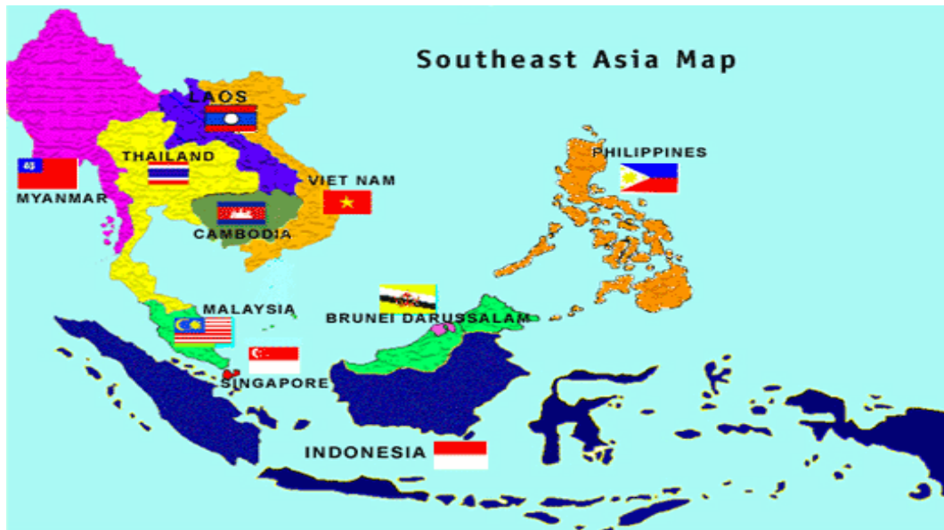
Ilustración 1: Mapa de países miembros de ASEAN.