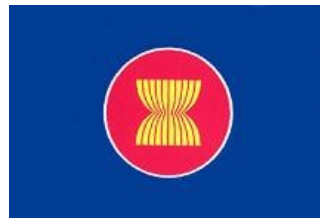
Bandera oficial de la Asociación de Naciones del Sudeste Asiático

Las crisis económicas tuvieron efectos devastadores en las economías nacionales. La reducción de la pobreza y el mejoramiento del desarrollo humano son objetivos primordiales de la ASEAN y de los organismos internacionales que trabajan en este terreno. Para 2007, antes de que comenzara la nueva crisis económica, el 29.4% de la población estaba por debajo de la línea de la pobreza, o vivía con menos de dos dólares por día. En países como Camboya y Laos las cifras son más alarmantes, ya que casi la mitad de la población vive por debajo de la línea de pobreza. Junto a la pobreza, otros flagelos atacan las sociedades de estos países: desnutrición y mortalidad infantil, y enfermedades pandémicas (el VIH/SIDA causa muchos muertos anualmente en esta zona). Además la pobreza se registra en las zonas rurales y la migración hacia las grandes ciudades de la región causa grandes desequilibrios en la salubridad y medio ambiente de las mismas. Son estos sectores más vulnerables los más afectados por los desastres naturales que azotaron a la región en el último quinquenio.